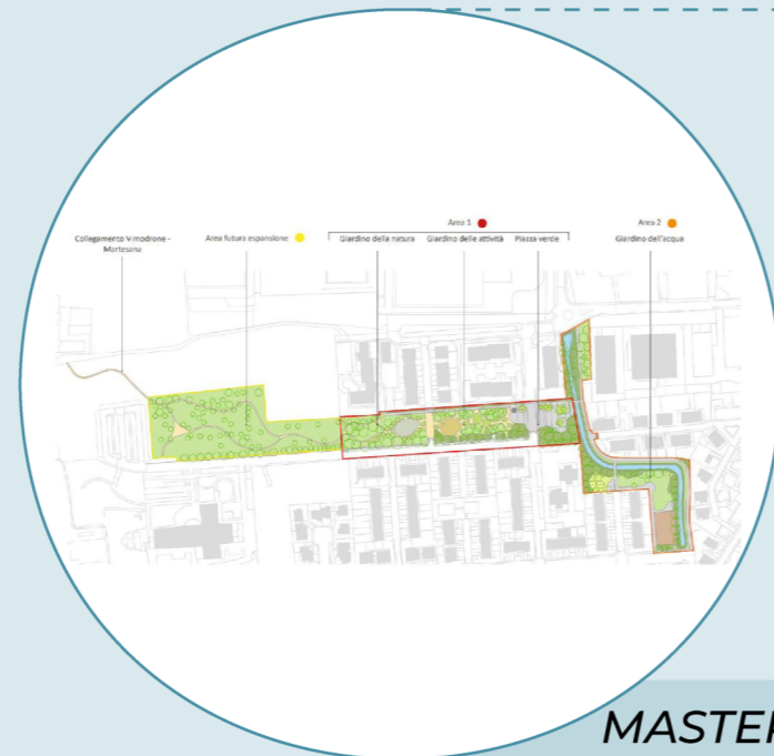
MASTERPLAN DI PROGETTO